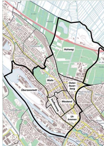
Walle und seine sieben Ortsteile: Hohweg, Osterfeuerberg, Steffensweg, Überseestadt, Utbremen, Walle und Westend