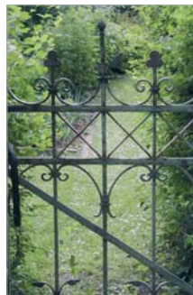
Kleingartensiedlung Waller Feldmark