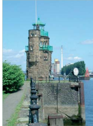
Der Molekurm an der Spitze des Holz- und Fabrikenhafens in der Überseestadt