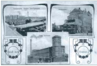
Die Bremer Jute-Spinnerei und -weberei an der Nordstraße, gegründet 1888