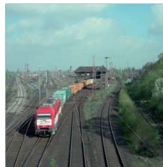
Rangierbahnhof Bremen-West Drehscheibe für den Güterverkehr auf der Schiene