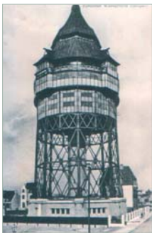
Blick auf den seinerzeit höchsten Wasserturm Europas