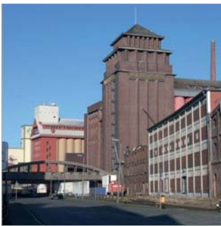
Gebäudeensemble am Holz- und Fabrikenhafen