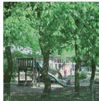
Eingebettet im Stadtteilgrün: KITA Waller Park