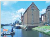
Holz- und Fabrikenhafen