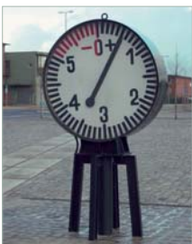
Pegel am Speicher XI