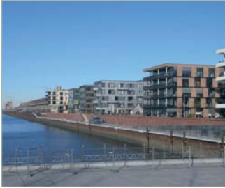
Blick in den Europahafen